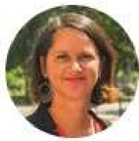
Johanna Rolland Maire - Ville de Nantes Présidente - France urbaine